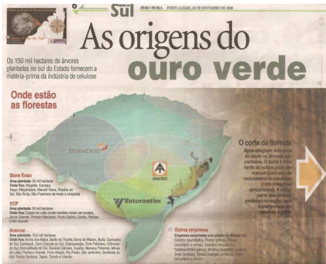
Figura 1: Onde estão as “florestas”.

produção de celulose e papel no Estado do Rio Grande do Sul. Atualmente o RS tem uma área de mais de 500 mil hectares 6 de monoculturas de árvores exóticas e segundo projeções deverá ter cerca de um milhão de hectares de plantações de pinus, eucalipto e acácia e investimentos da ordem de R$ 6,1 bilhões até 2015. Além dos investimentos ditos como “florestais” (leia-se monoculturas de árvores exóticas) as empresas pretendem instalar três fábricas de celulose no RS. Segundo consta, a Stora Enso pretendia instalar uma unidade de produção de celulose na fronteira-oeste do RS em sete anos. Já a Aracruz pretendia quadruplicar sua fábrica já instalada em Guaíba. E, finalmente, a VCP pretendia instalar uma fábrica de celulose branqueada na metade sul do Estado, possivelmente em Rio Grande ou Arroio Grande.